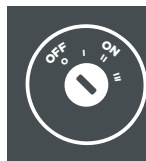
POSICIONES DE IGNICIÓN DE HONDA

Diagrama: 0 - Apagado, II - Encendido, III - Arranca el motor