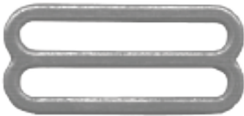
BOUCLE CODE: DLN (4)