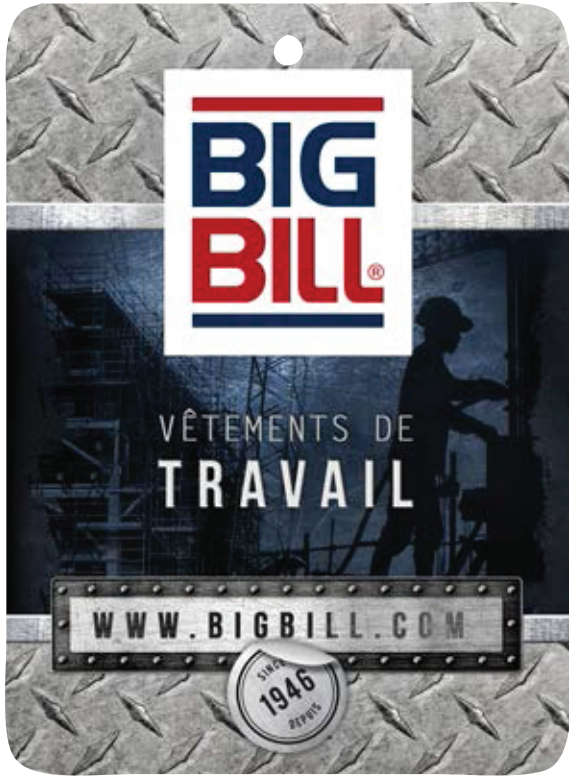
HANGTAG CODE: HV1