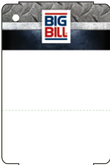
BARCODE CODE: HBF