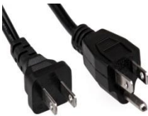
USA plug 110-120 can also be used in JAPAN USA bouchon 110-120 peut également être utilisé au Japon.