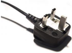
UK plug 220-240 volt Prise UK 220-240 volts

Avant utilisation, vérifier votre fiche pour s'assurer qu'il est la tension appropriée pour votre pays.