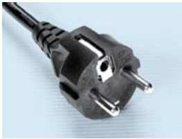
EURO plug 220-240 volt EURO prise 220-240 volts