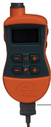
CONNETTORE CARICABATTERIE INSERITO NELLA PRESA DI RICARICA DEL TRASMETTITORE

Nota: l'autonomia della batteria tra una ricarica e l'altra è compresa all'incirca nell'intervallo da 50 a 70 ore, a seconda della frequenza di utilizzo.