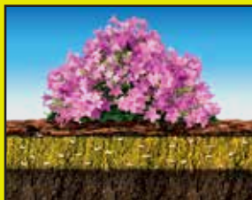
Preventing creates a weed barrier that stops weeds* from germinating.

Reapply every 3 months. It's never too late or too early to apply Preen Garden Weed Preventer! Use around listed flowers, vegetables, trees and shrubs.