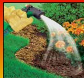
Water Product Into Soil