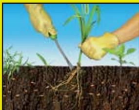
Pulling or spraying only eliminates weeds already above ground.