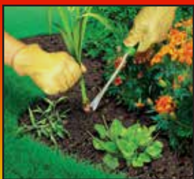
Remove Existing Weeds