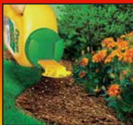
Sprinkle Product Evenly